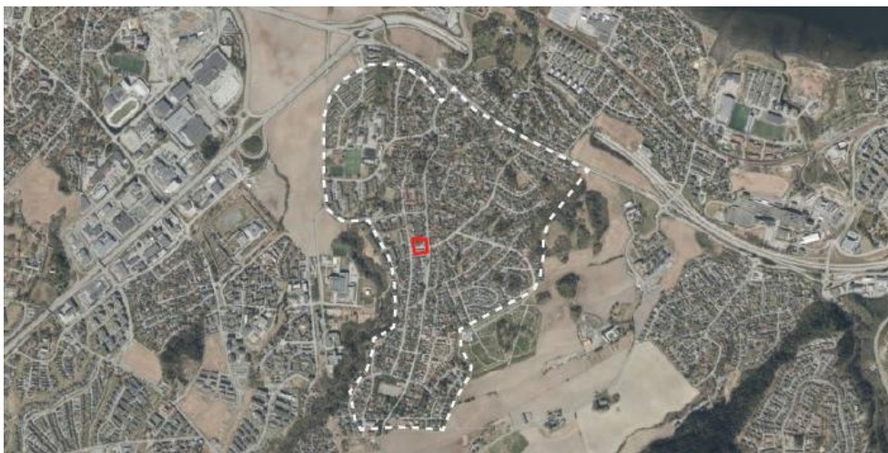
Charlottenlund bydel med Jakobslivegen 51 og 53 markert i rødt.

Området er dag regulert til forretning/ kontorbebyggelse og offentlige formål/ kirke i vedtatt reguleringsplan fra 1970.