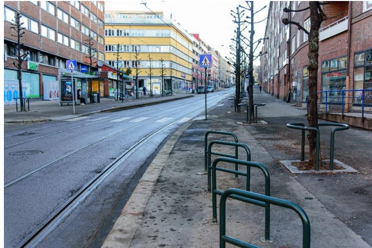
Figur 3-4: I Trondheimsveien ved Sofienberg holdeplass ble parkeringsplasser fjernet, fortau utvidet og sykkelparkering anlagt.

Parkeringsfjerning kan gi effekt på både kjøretid og pålitelighet ved at buss- og trikkefører kan kjøre fortere fordi kjørebanelik er bredere, sikten er bedre og ved å redusere sannsynligheten for full stans som følge av feilparkering. Ulempen ved tiltaket er at bilister får færre steder de kan parkere. Bilister må dermed finne andre gater å parkere i eller bruke privat parkering. Parkeringsfjerning er et politisk sensitivt tiltak, da det reduserer tilgang på bilparkering og noe som påvirker muligheten til å eie og velge bil som reisemiddel. Dette gjør at slike prosjekter kan være vanskeligere å gjennomføre enn andre.