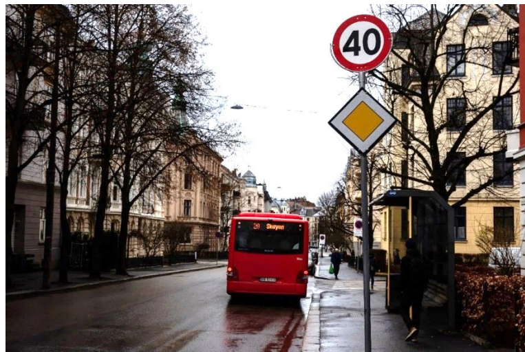
Figur 3-2: Skilt for forkjøringsregulering av Thomas Heftyes gate

Forkjøringsregulering innebærer å skilte en vei eller gate med forkjøringsregulering, slik at bussene og andre trafikanter ikke trenger å vike for trafikk fra sidegater. Tiltaket krever i utgangspunktet kun endring i skilting og oppmerking, men det kan være behov for trafiksikkerhetsmessige vurderinger for at skiltmyndigheten skal godkjenne nye forkjøringsregulerte gater.