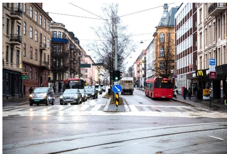
Figur 3-1: Kollektivfelt i Kirkeveien sett fra Majorstukrysset

Et kollektivfelt er et kjørefelt for kollektivtrafikk, men som hovedregel også kan brukes av syklende og elbil så sant det ikke er skiltet noe annet. I 2021 ble de fleste kollektivfelt i Oslo skiltet om slik at de kun kan benyttes av elbiler med minst én passasjer.