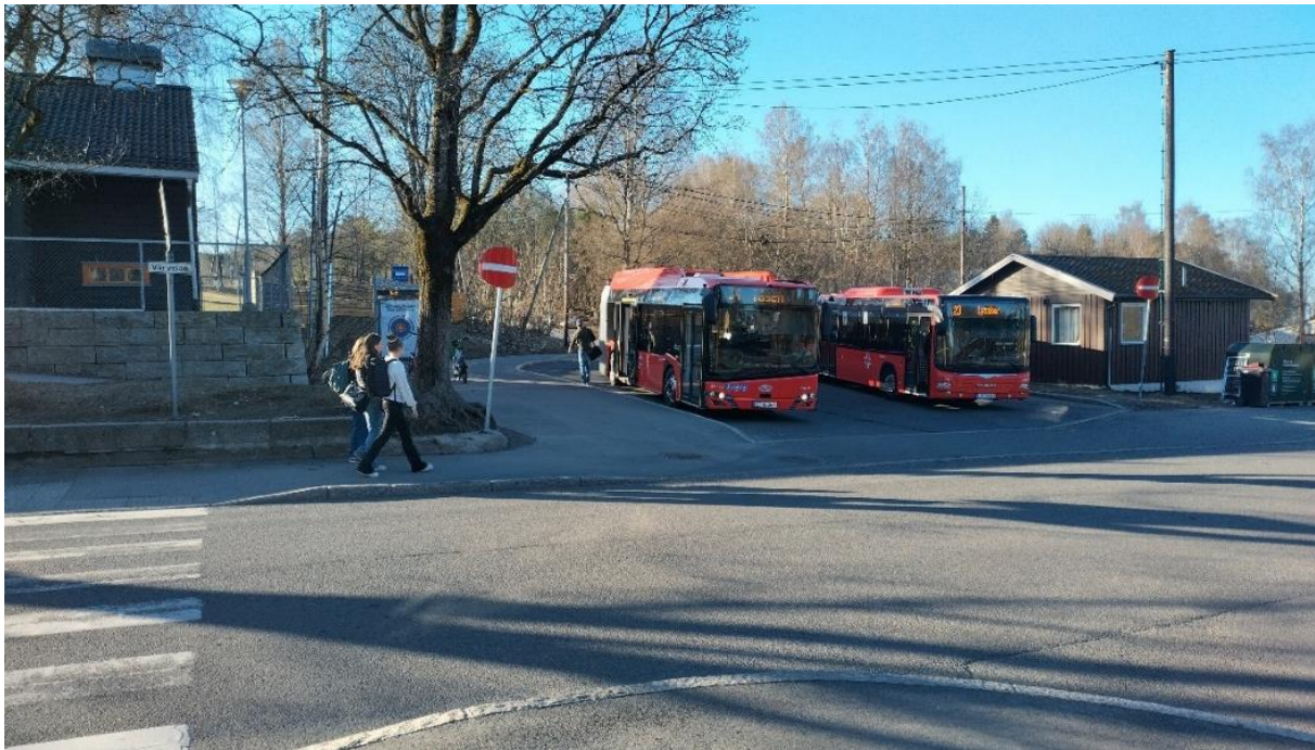
Figur 3-5: Endeholdeplass ved Simensbråten

Tiltakene er beskrevet og analysert i vedlegg 6. Hovedfunnene er oppsummert i denne rapportens avsnitt 4.2.8.