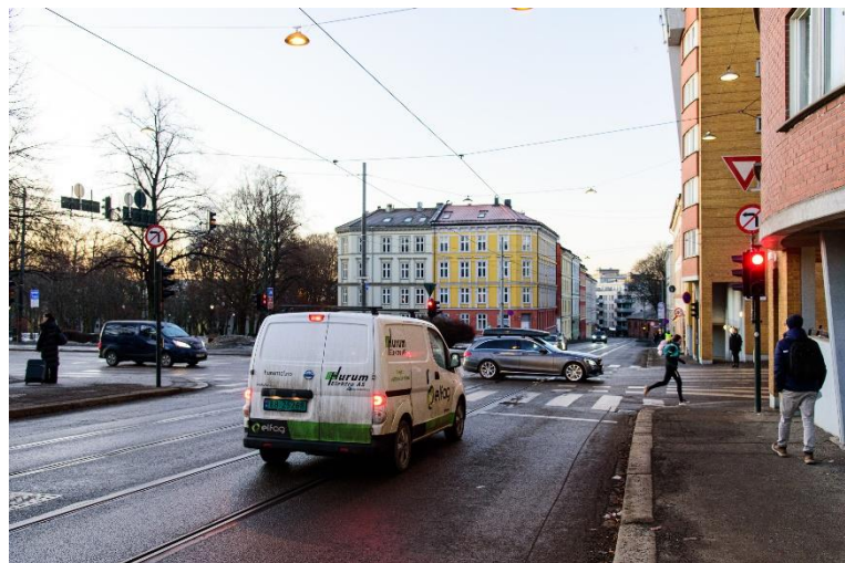
Figur 3-3: Venstresvingeforbud i krysset Vogts gate x Ring 2

Venstresvingeforbud er evaluert i krysset Vogts gate x Ring 2, og det er beskrevet i vedlegg 4 om forkjørsregulering fordi forbudet ble innført sammen med forkjørsregulering av Vogts gate. Hovedfunnene er oppsummert i denne rapportens avsnitt 4.2.5.